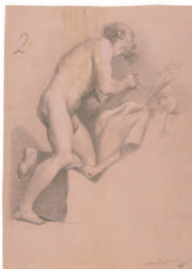
FIG. II.14.1. VICENTE LÓPEZ ENGUIDANOS. Academia . Madrid. Biblioteca de la Facultad de BB.AA. de la Universidad Complutense

Todavía prosigue resultando complicado dilucidar en que dirección esbozaría Maella esta glosa de la ancianidad, si en la Accademia di San Luca o en la Académie de France . Sin embargo lo que sí se puede afirmar es que en esta ocasión su director pretendió con esta inusual postura lanzar a sus discípulos un reto diferente a los dibujos que habían venido concibiendo en jornadas precedentes. Al mismo tiempo parece paradójico que el valenciano abordara con éxito esta tarea teniendo en cuenta que algún tiempo después, en septiembre de 1763, desde Madrid se le advertiría de la con-