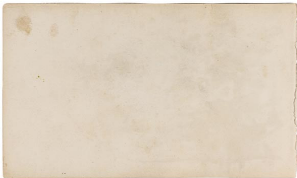
Page 14, verso