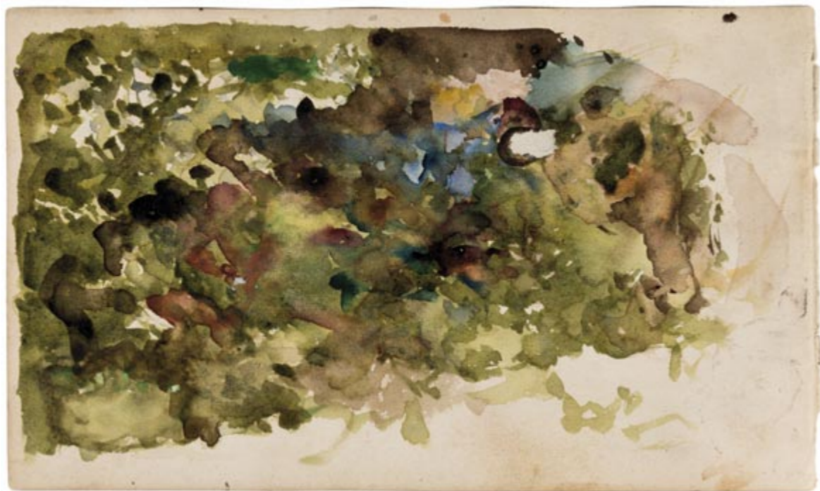
Page 23, verso