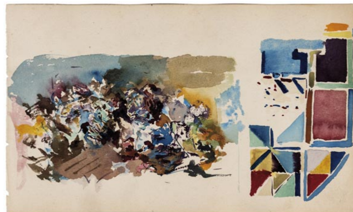
Page 13, recto