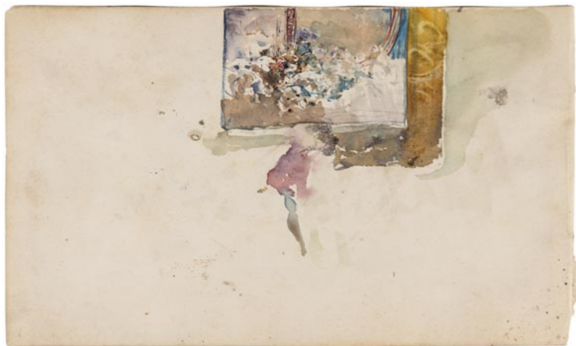
Page 8, verso