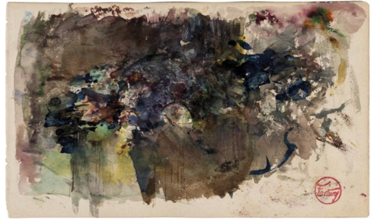
Page 14, recto