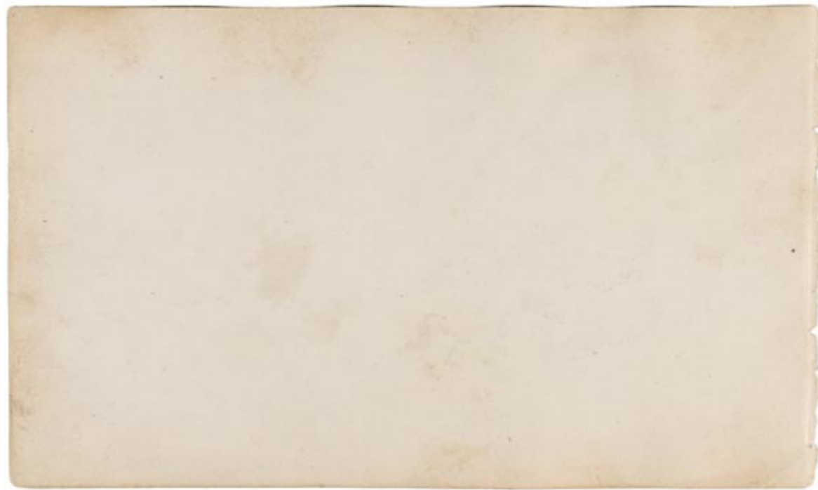
Page 7, verso