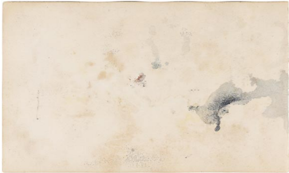
Page 18, verso