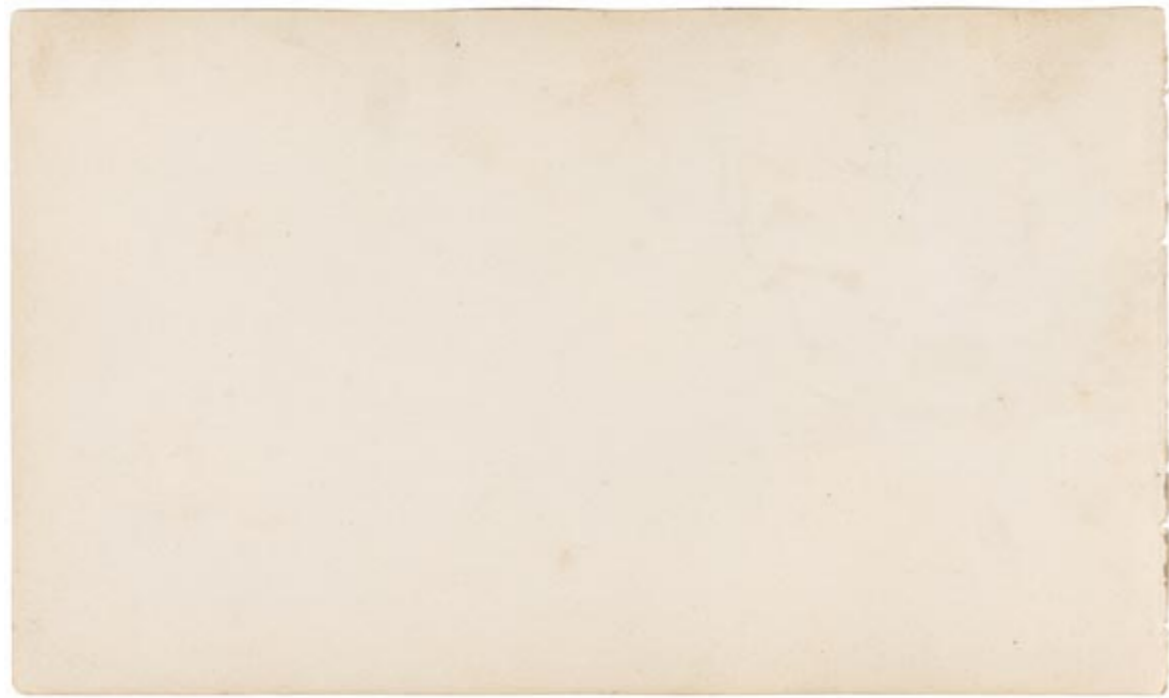
Page 19, verso