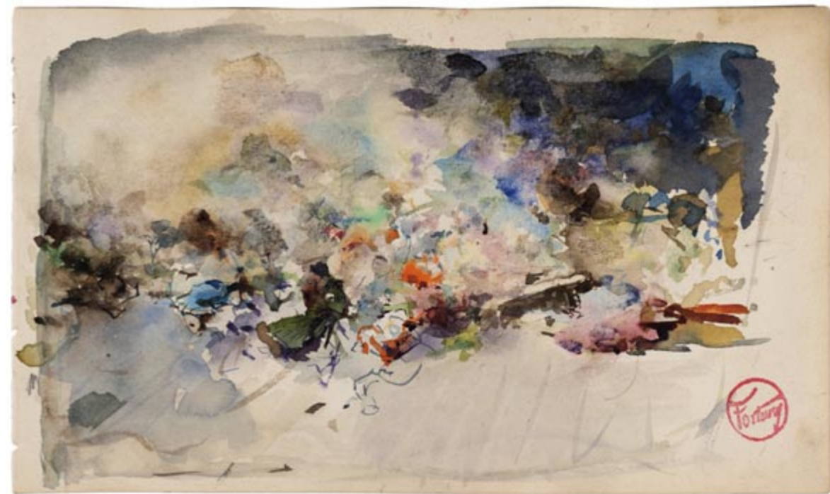
Page 24, recto