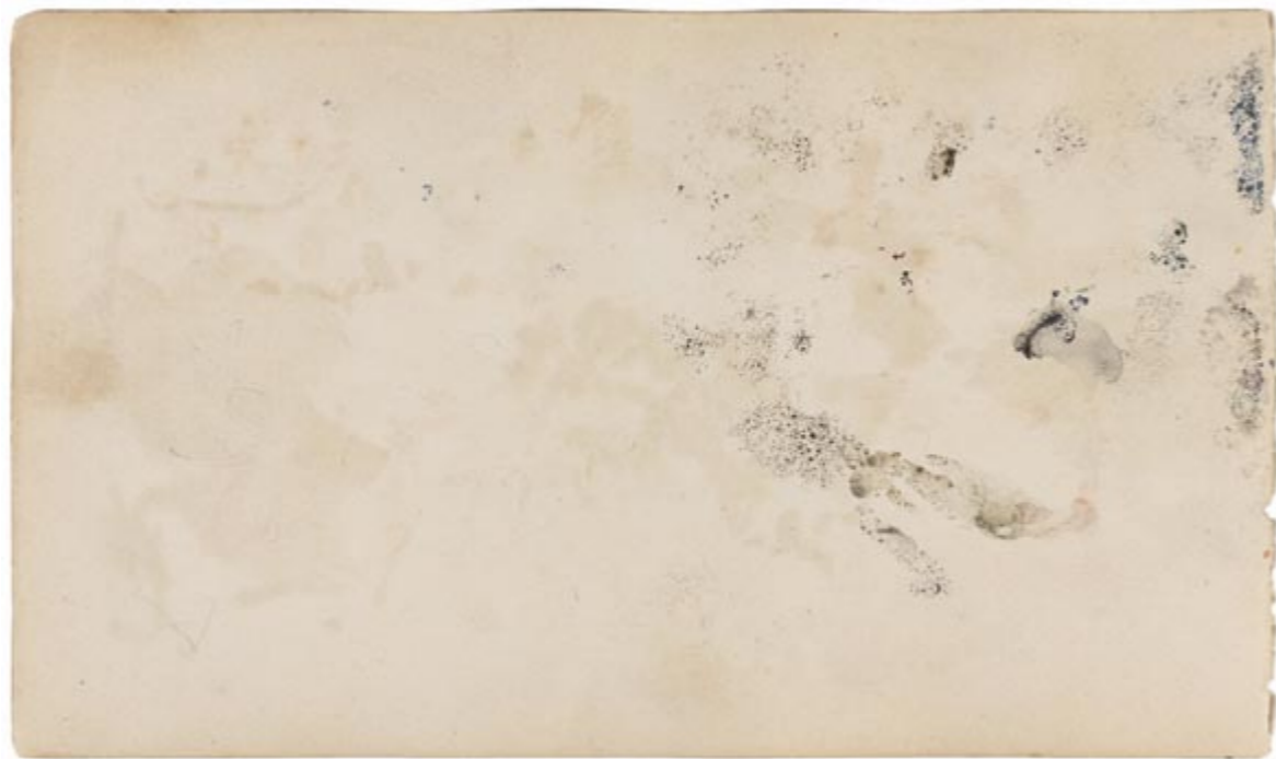
Page 15, verso