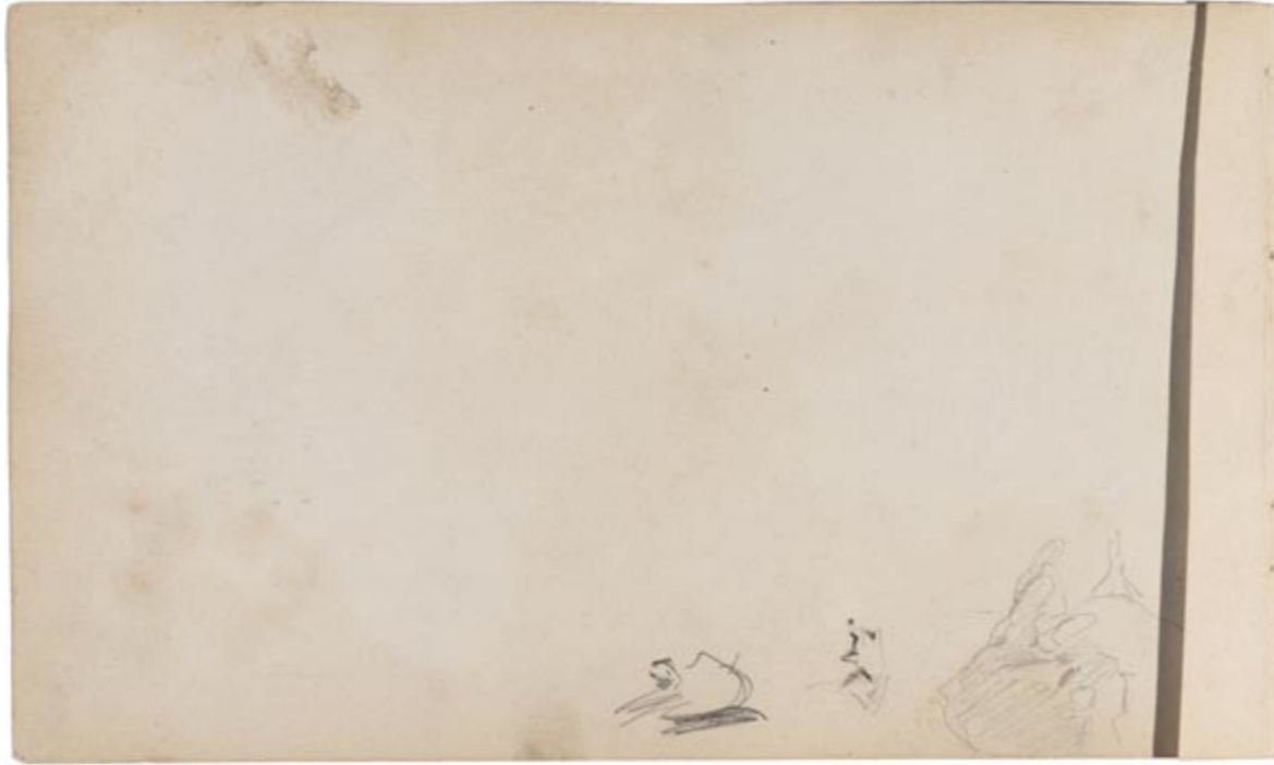
Page 1, verso