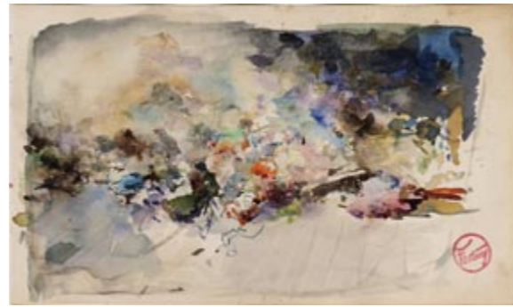
Fig. 9 Mariano Fortuny, Composition , recto of page number 24 of the sketchbook, c. 1870-1874. Watercolour on paper, 123 x 205 mm. Madrid, private collection.

Regarding the supposed Granadan affiliation of the sketchbook, there is some evidence that supports this hypothesis. In this regard, the existence of a small group of drawings, which,