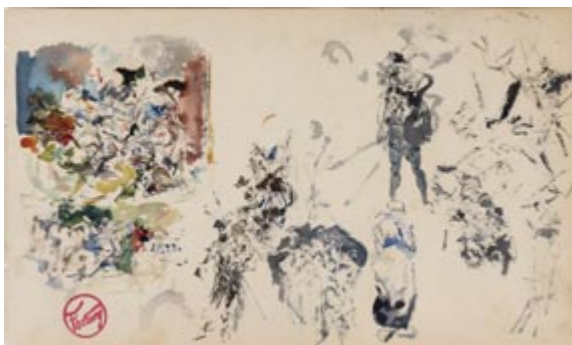
Fig. 11 Mariano Fortuny, Composition , recto of page number 1 of the sketchbook, c. 1870-1874. Watercolour on paper, 123 x 205 mm. Madrid, private collection.