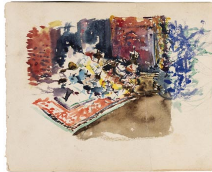
Page 21, recto