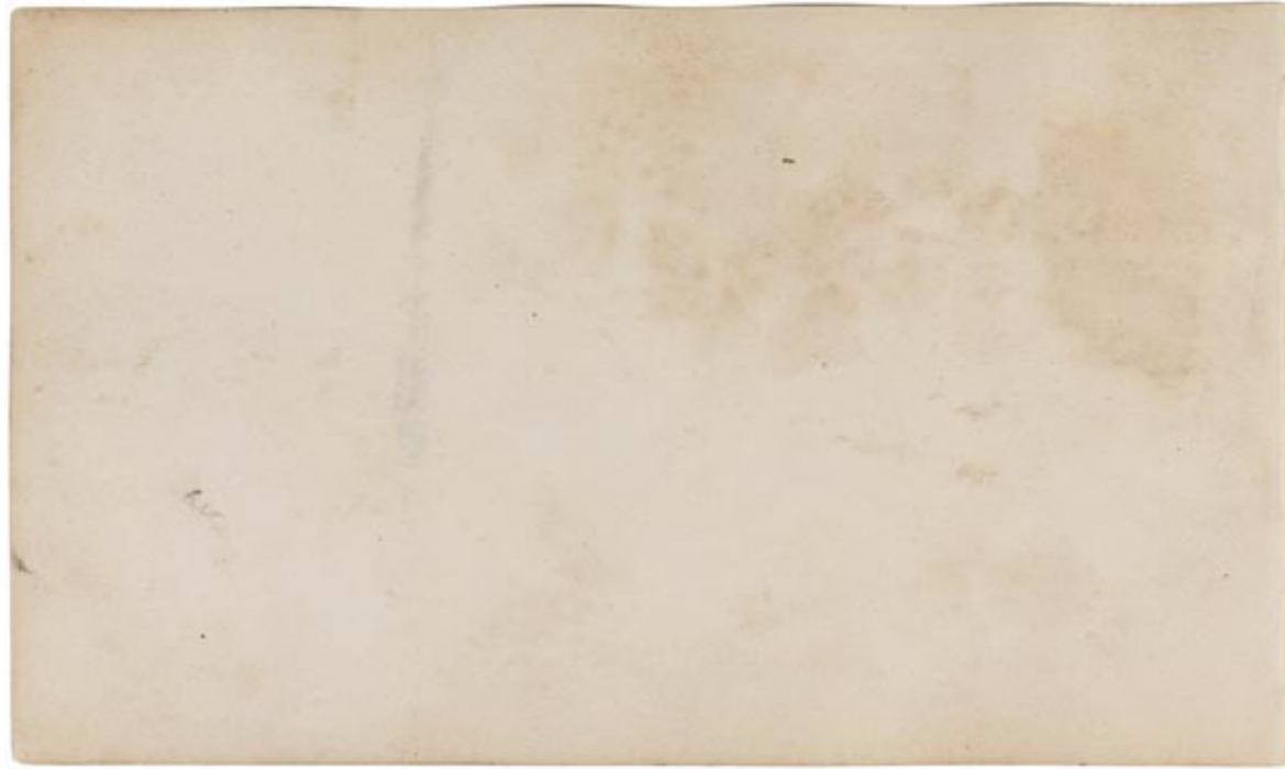
Page 22, verso