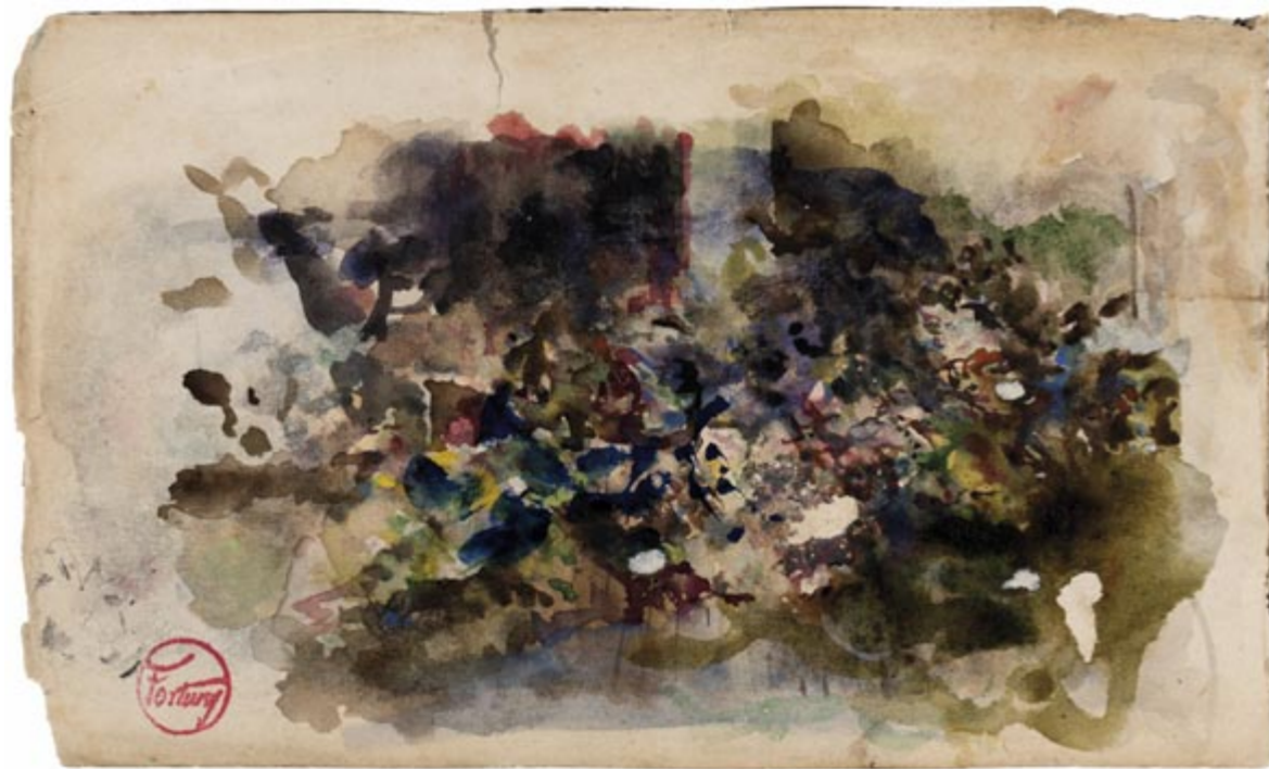
Page 25, verso