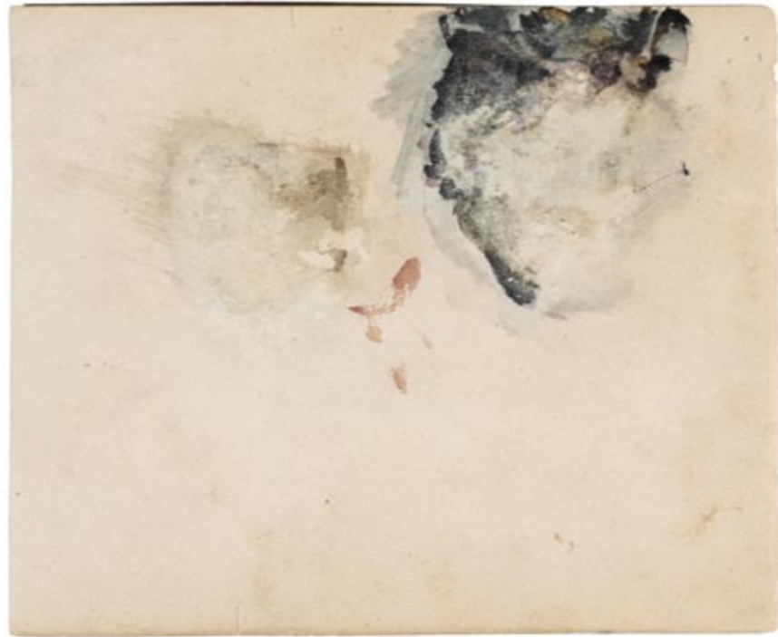
Page 21, verso