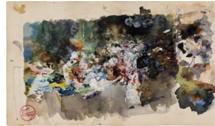
Fig. 6 Mariano Fortuny, Composition , verso of page number 10 of the sketchbook, c. 1870-1874. Watercolour on paper, 123 x 205 mm. Madrid, private collection.

This Nasrid atmosphere can be perceived in many of the compositions which, although they cannot be directly linked to any of his most famous works from that period, evoke certain pictorial episodes. More specifically, the compositional execution of some of them recalls the unfinished painting Carnival in Granada , also known as Contrasts of Life (National Museum of Visual Arts, Montevideo). The treatment of groups, chromatic richness, and the unmistakable influence of Japanese aesthetics are some of the aspects that we recognize both in the pictorial work and in some of the drawings that make up the sketchbook. Incidentally, Japanese influence is openly perceptible on most of its pages, functioning as one of the figurative cultures from which the artist sought a constant source of inspiration.