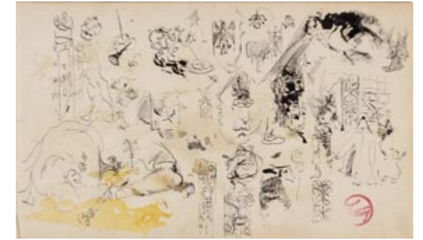
Fig. 12 Mariano Fortuny, Composition , recto of page number 4 of the sketchbook, c. 1870-1874. Watercolour on paper, 123 x 205 mm. Madrid, private collection.