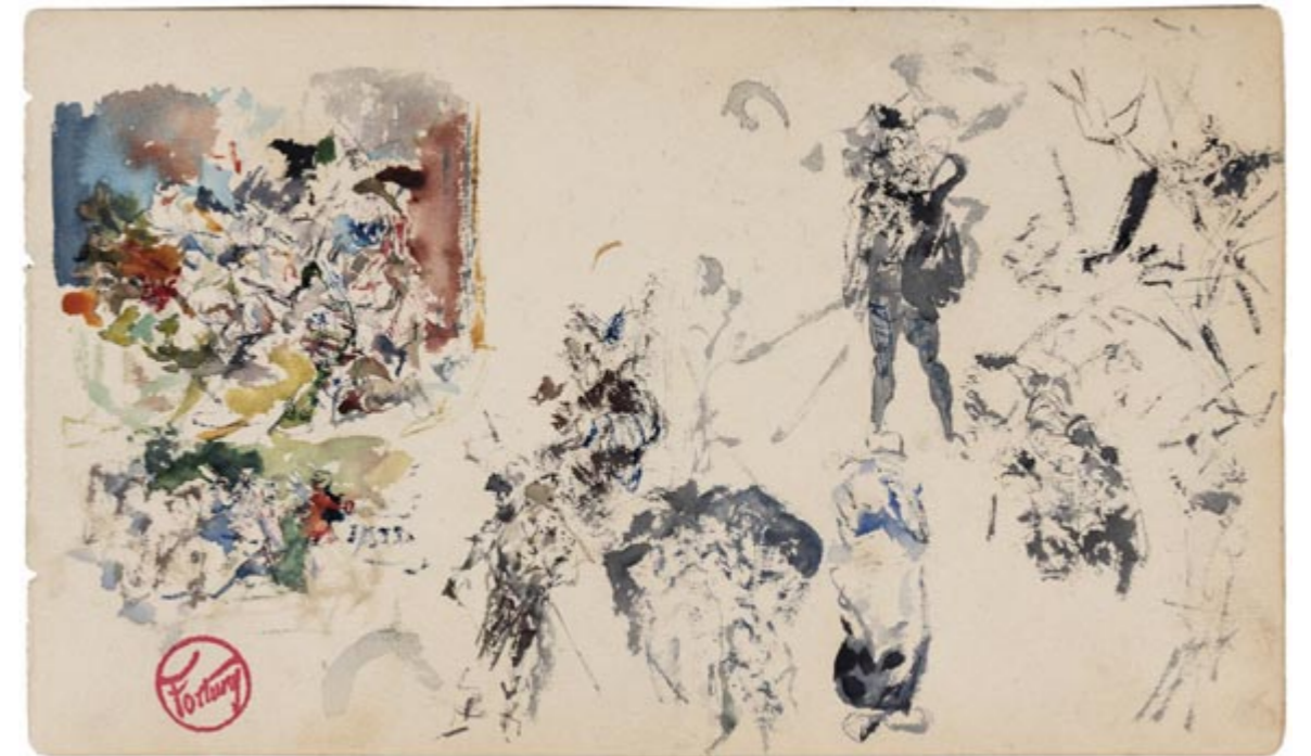
Page 6, recto