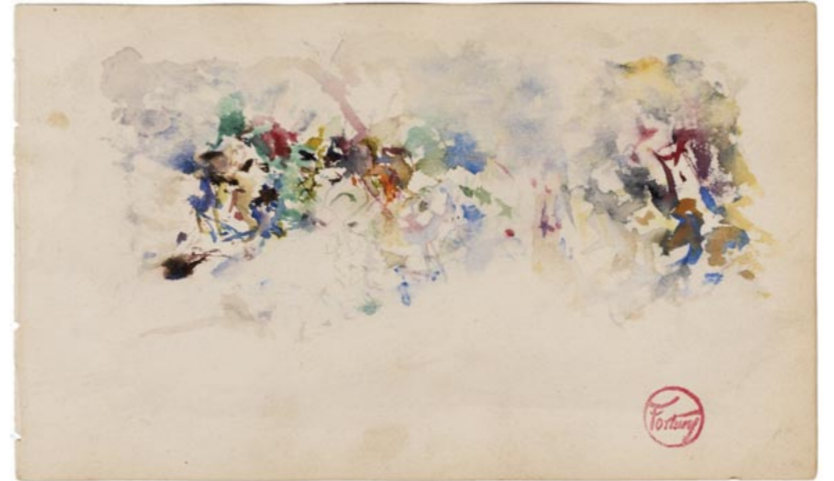
Page 17, recto