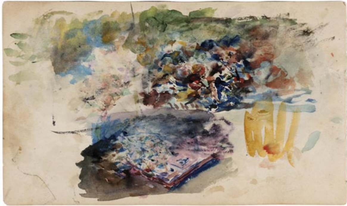
Page 5, verso