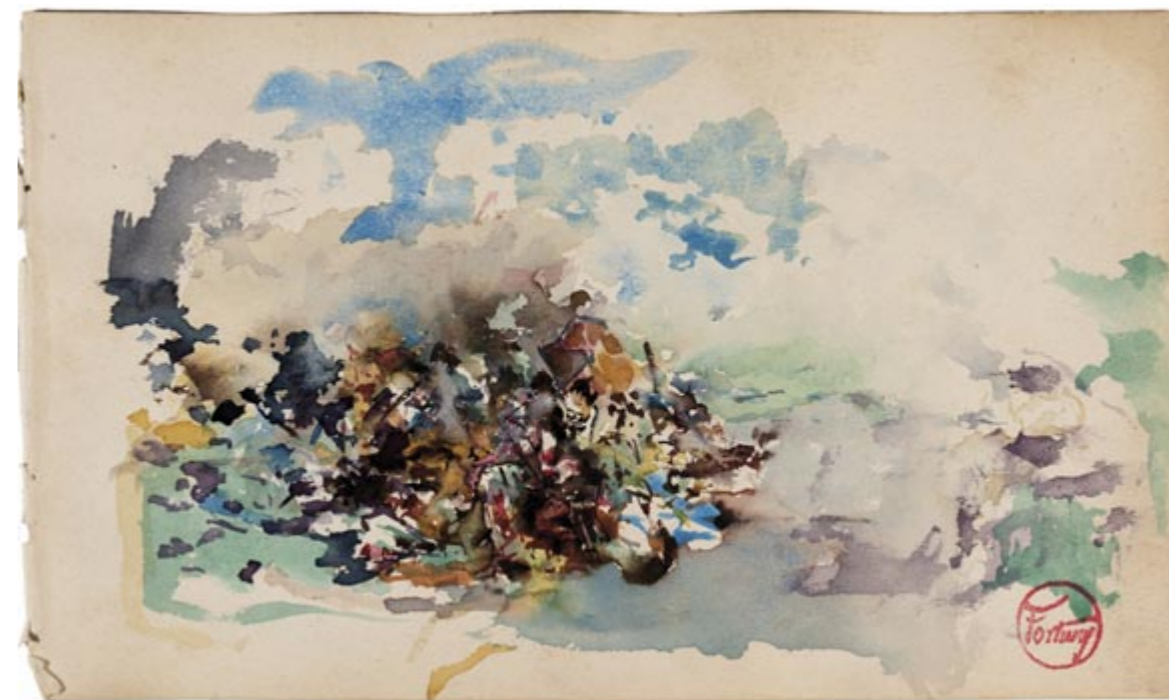
Page 16, recto