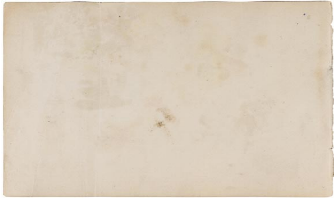
Page 3, verso