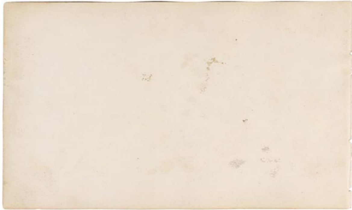
Page 17, verso