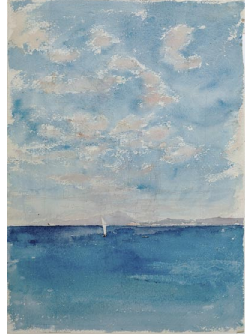
Mariano Fortuny, Sea with Mount Vesuvius in the Background , 1874. Watercolour on paper, 350 x 253 mm. Madrid, Prado Museum, cat. D006220

Art historian and curator of Fortuny's sesquicentenary