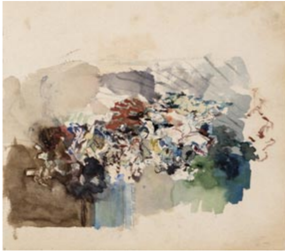
Fig. 8 Mariano Fortuny, Composition , recto of page number 20 of the sketchbook, c. 1870-1874. Watercolour on paper, 123 x 124 mm. Madrid, private collection.

sensation is transmitted by other pages of the sketchbook, such as numbers 20 (recto, fig. 8) and 24 (recto, fig. 9), in which the mass of colour seems to have formed a group of people, a procession, in which, in the former case, one can distinguish the appearance of a figure positioned to the viewer's left, whose silhouette has been drawn with a very subtle ink line. The rest of the group, whose movement appears to have been merely suggested by the artist, gives the impression of shifting toward the viewer's left, without clearly defined human forms.