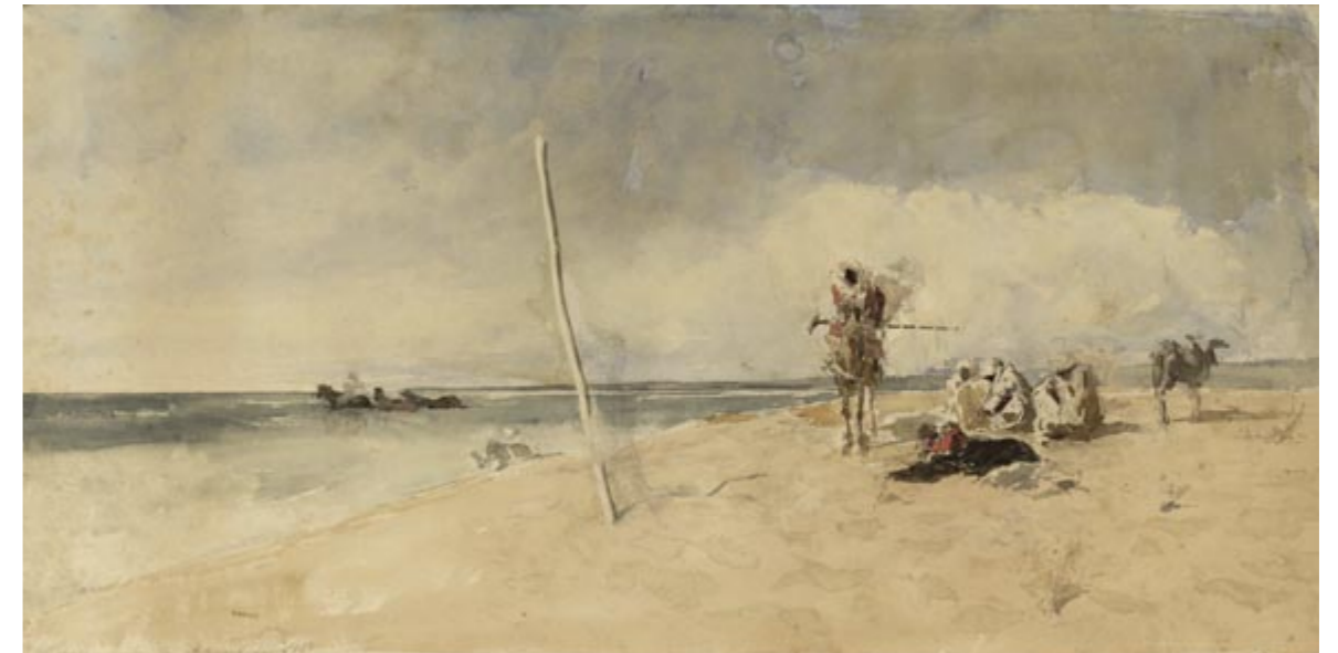
Mariano Fortuny, African beach , c. 1867. Watercolour on paper, 315 x 610 mm. Barcelona, MNAC, cat. 010696-D

Historiador del arte y comisario del año Fortuny