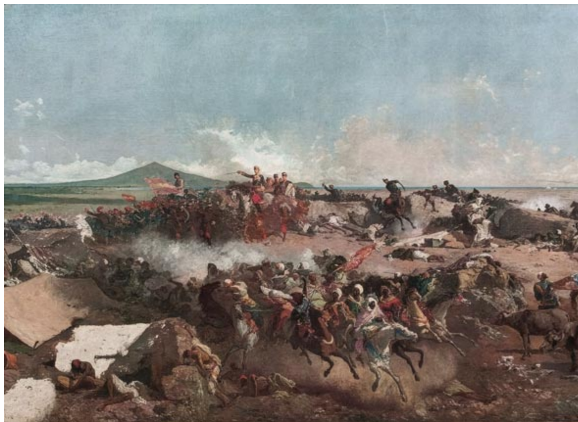
Fig. 2 Mariano Fortuny, Battle of Tétouan , 'detail', c. 1862-1866. Oil on Canvas, 300 x 972 cm. Barcelona, MNAC, cat. 010695-000

professional profile, at times scarcely recognizable in relation to his previous trajectory. One of the most evident manifestations of what we might describe as a crisis of growth was the appearance of a large number of unfinished works, which, in the eyes of his contemporaries, amounted to the confirmation of a failure. The distance separating desire from reality, or the inability to bring the artistic idea to fruition, for a nineteenth-century mentality, revealed the vulnerability of the artistic subject; it constituted the clearest proof of the existence of a flaw in the system. Until then, this system had appeared to operate as a perfect machine, without any fissures or weaknesses that might suggest that within the painter there resided a personality beginning to show doubts, hesitations, and, more troubling still, signs that the model that had allowed him to amass