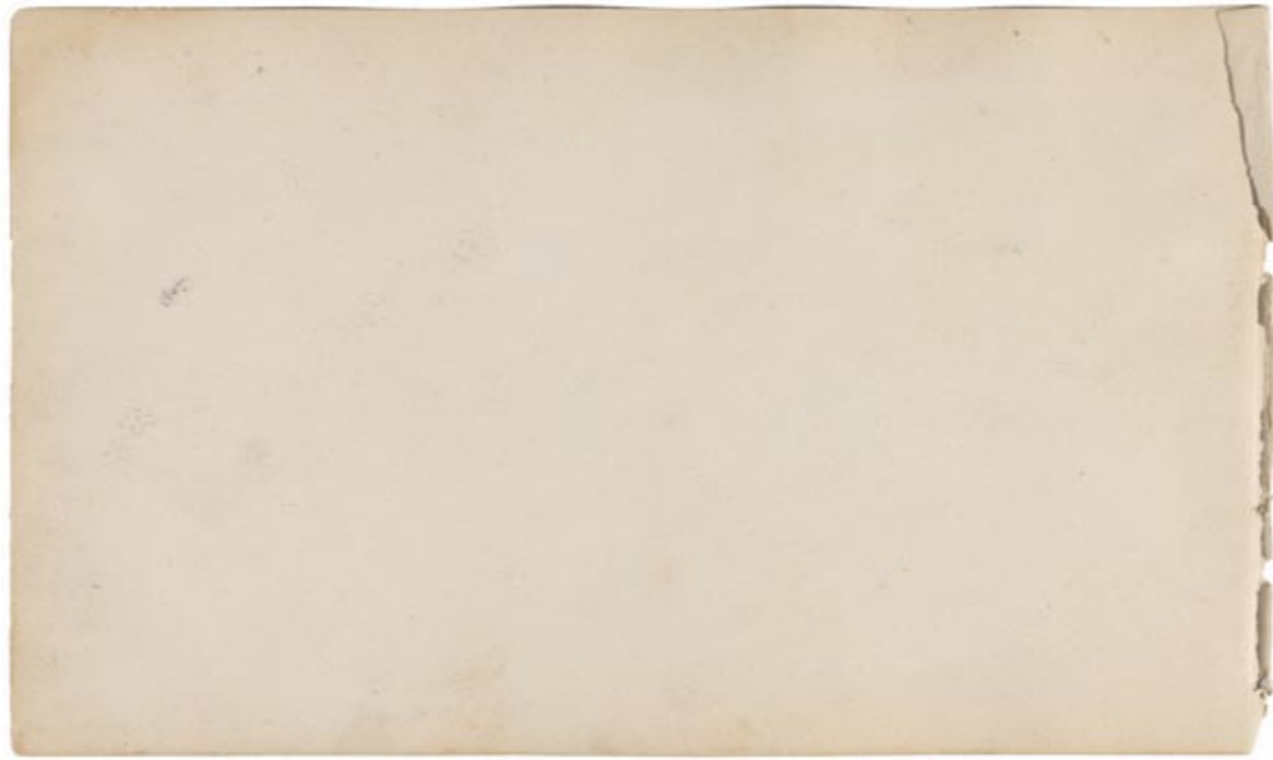
Page 16, verso