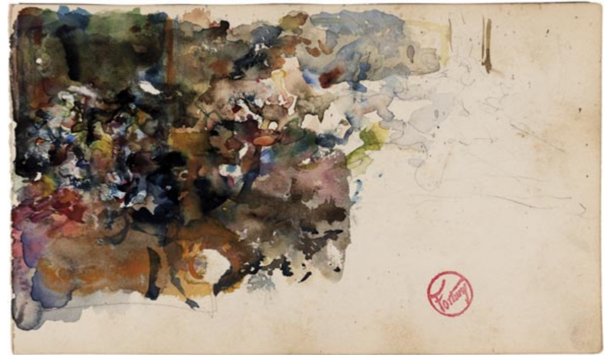
Page 11, recto