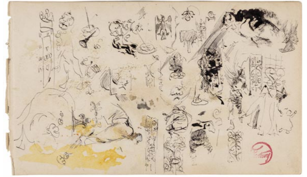
Page 4, recto