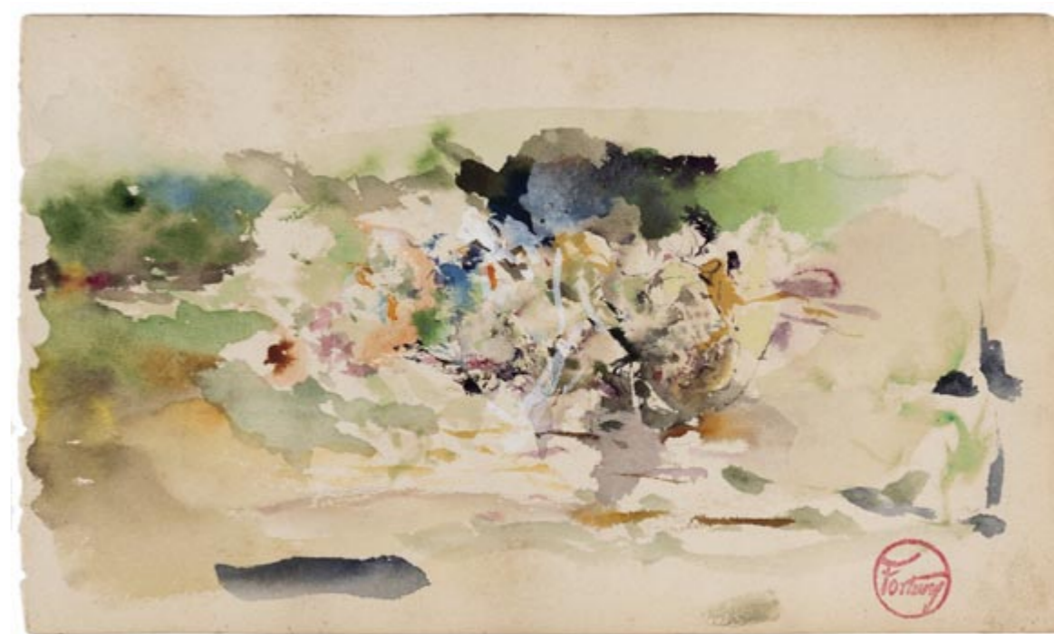
Page 15, recto