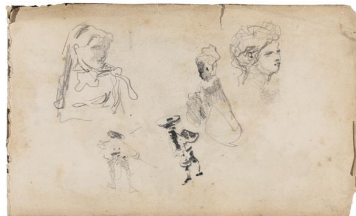
Page 25, recto