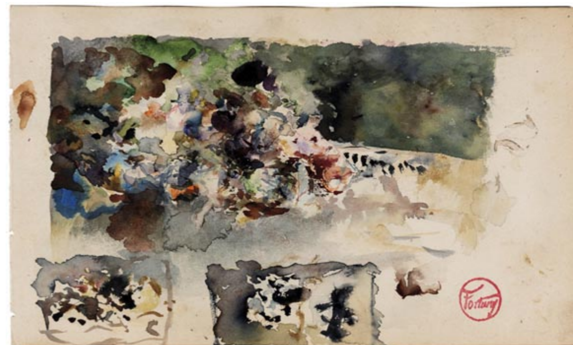
Page 9, recto