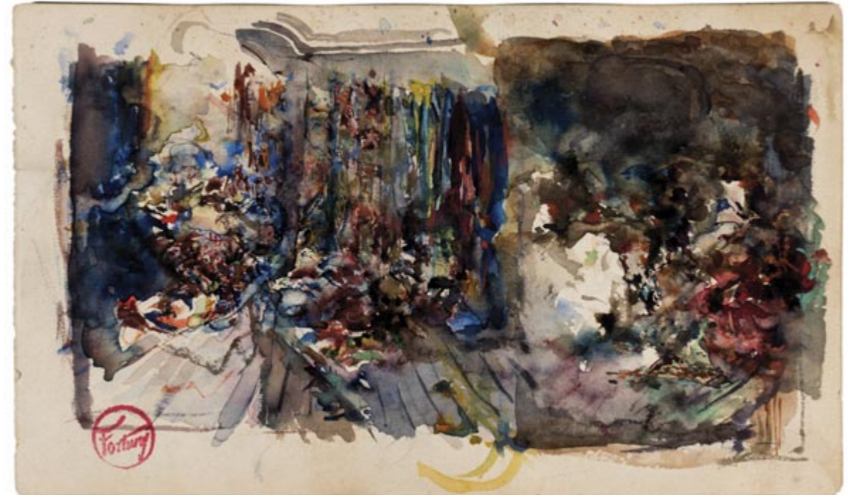
Page 5, recto