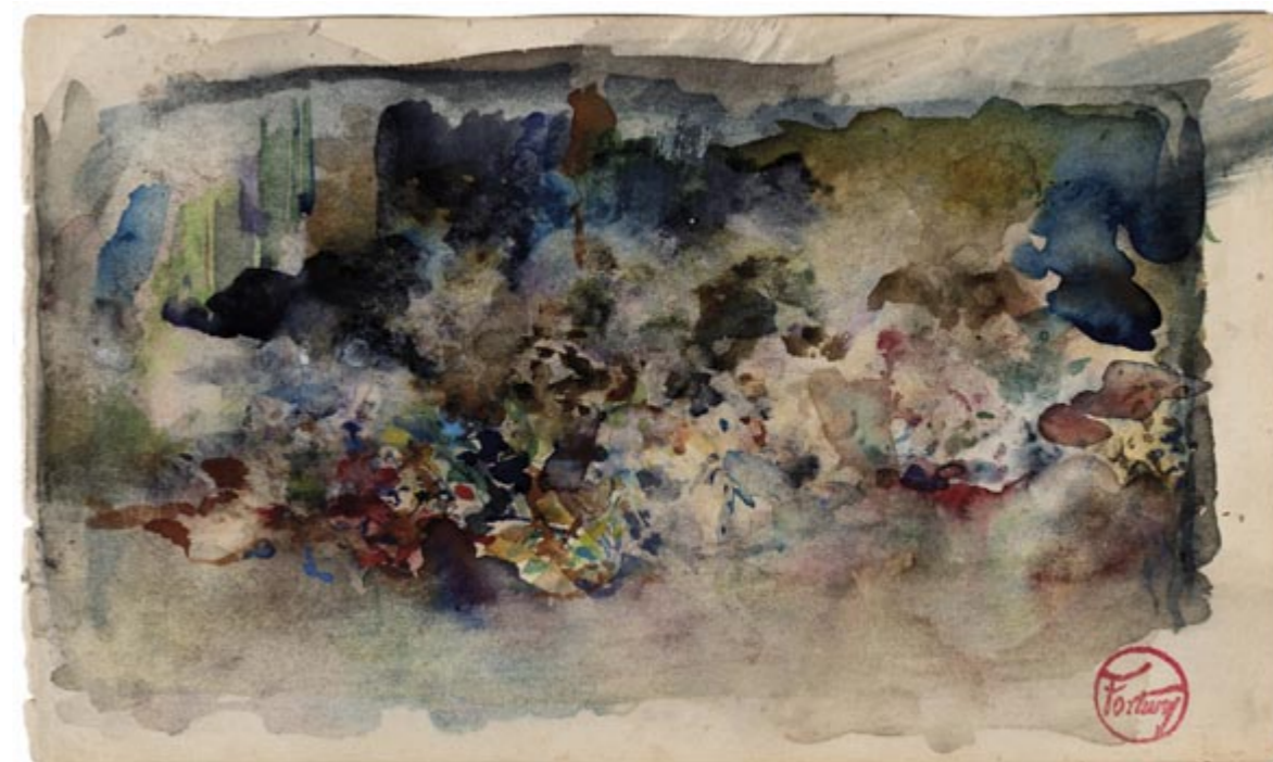
Page 7, recto