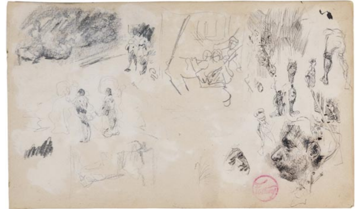
Page 1, recto