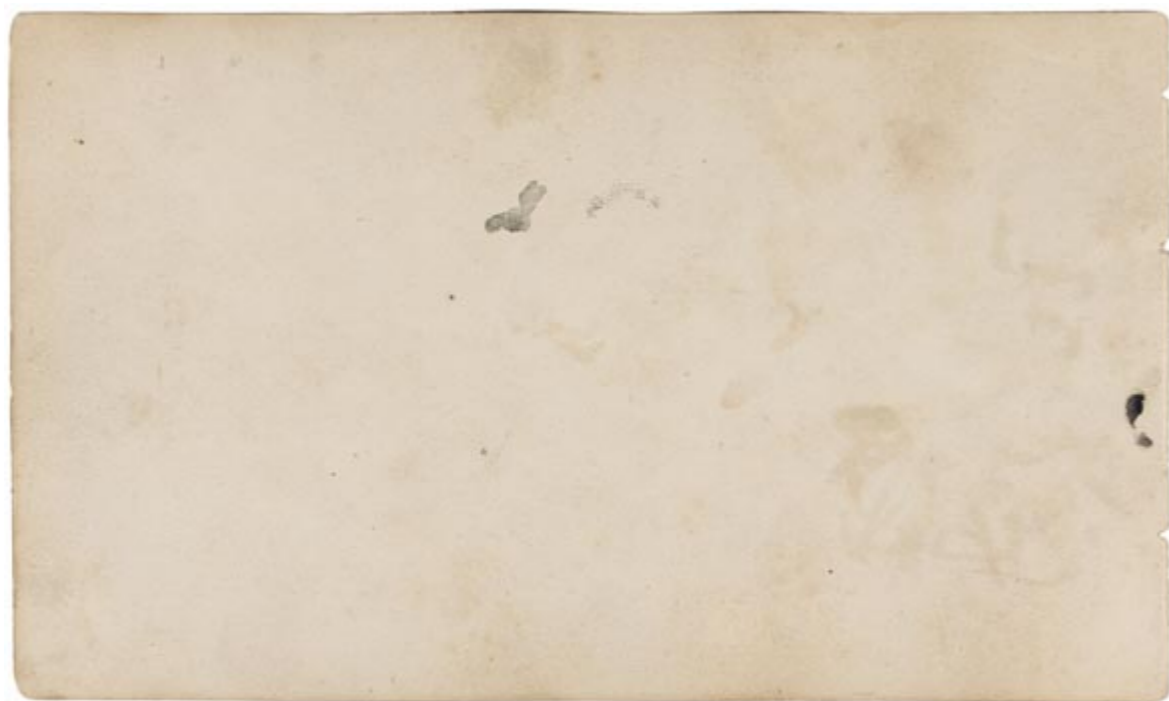
Page 6, verso