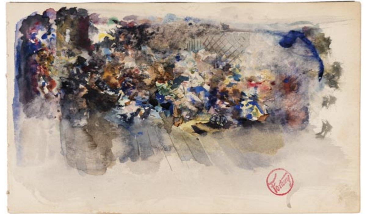
Page 18, recto