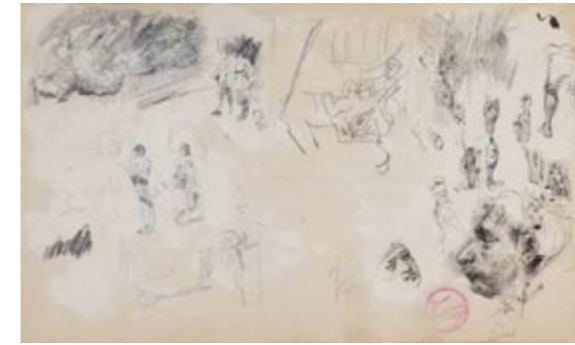
Fig. 11 Mariano Fortuny, Composition , recto of page number 1 of the sketchbook, c. 1870-1874. Watercolour on paper, 123 x 205 mm. Madrid, private collection.