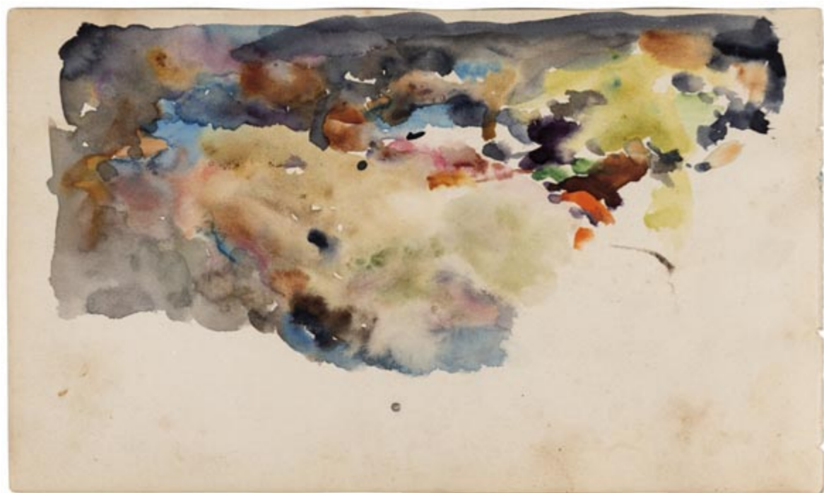
Page 24, verso