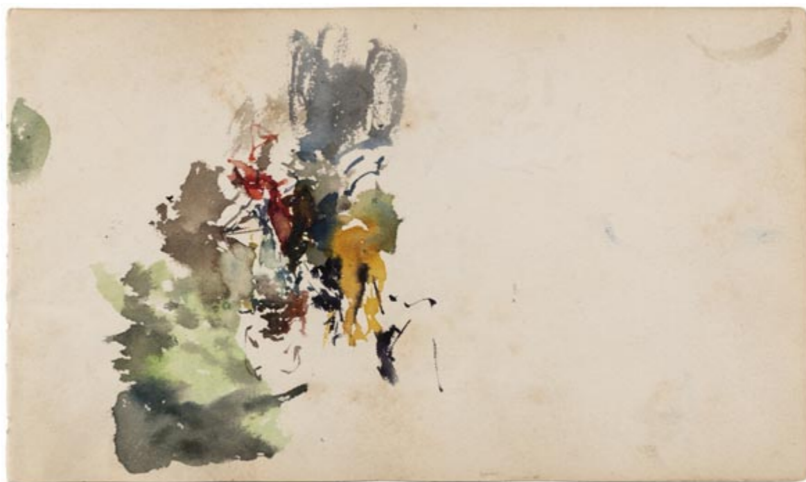
Page 11, verso