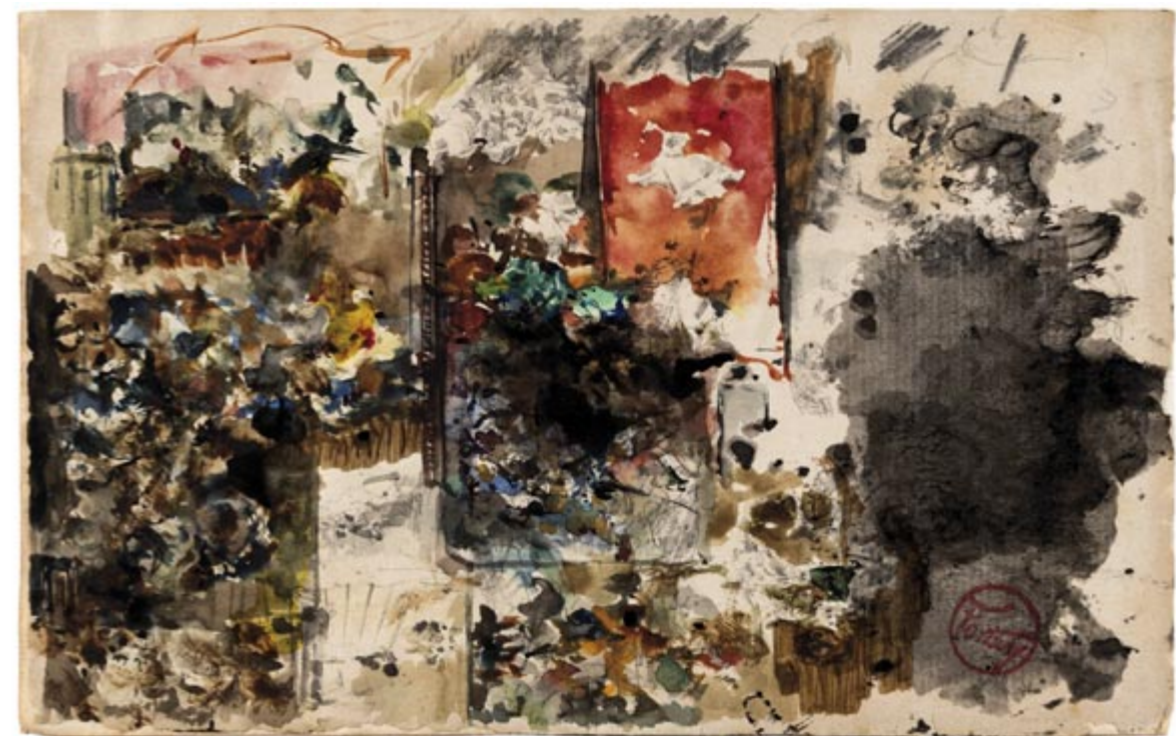
Page 26, recto