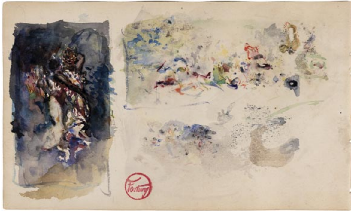
Page 13, verso