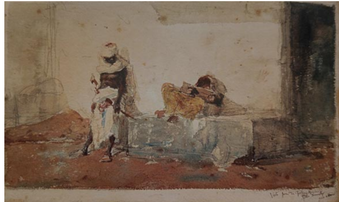
Mariano Fortuny. Mutilated Arab prisoner with a guardian , c. 1868-1869. Watercolour and pencil on paper, 262 x 413 mm. Private collection

La reciente aparición en el comercio artístico de un álbum con dibujos del pintor Mariano Fortuny (Reus, Tarragona, 1838–Roma, 1874), que había pertenecido a una colección privada, viene a corroborar la importancia que para el reusense tuvo la práctica de una disciplina en la que llegó a alcanzar un alto grado de excelencia.