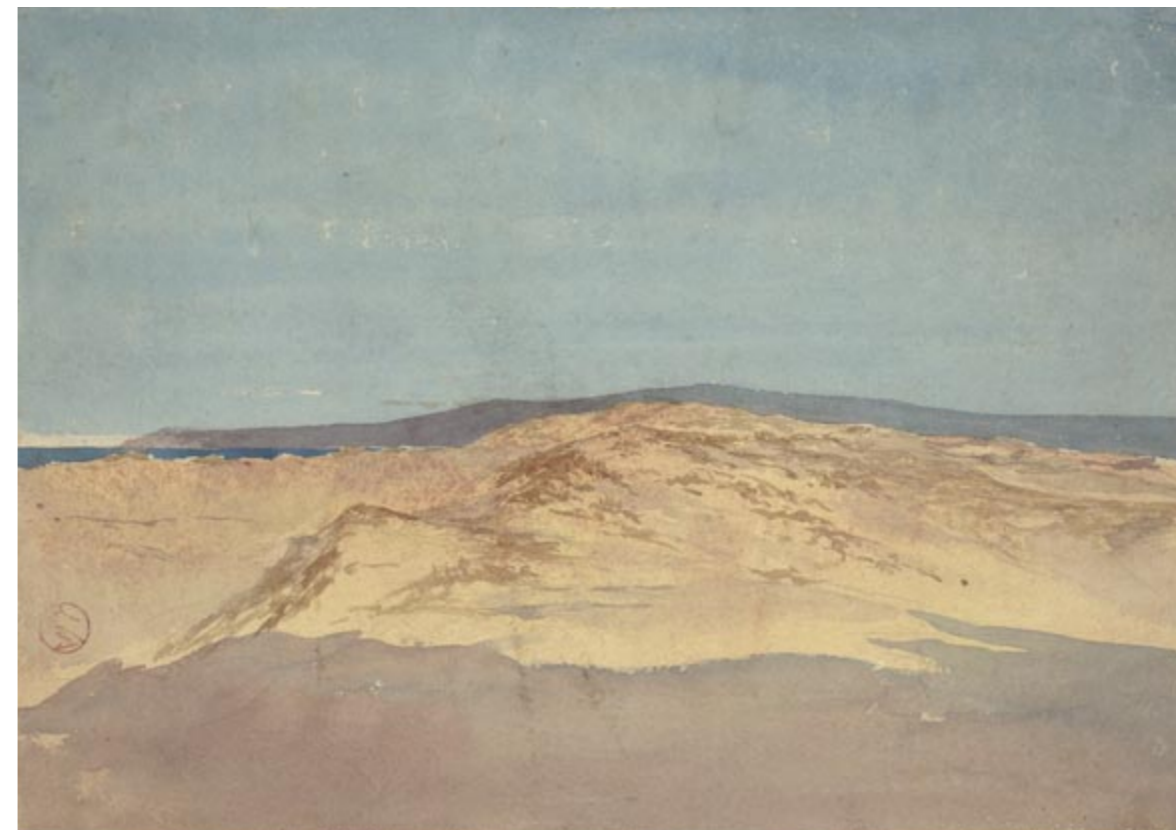
Mariano Fortuny, Sand with Mountain Line. Morocco , c. 1860. Watercolour and pencil on paper, 262 x 373 mm. Madrid, Prado Museum, cat. D006222

Undoubtedly, the work represents a significant contribution, shedding light on a previously underexplored facet of the artist's creative