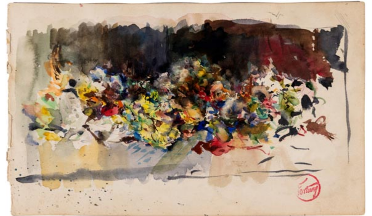
Page 23, recto