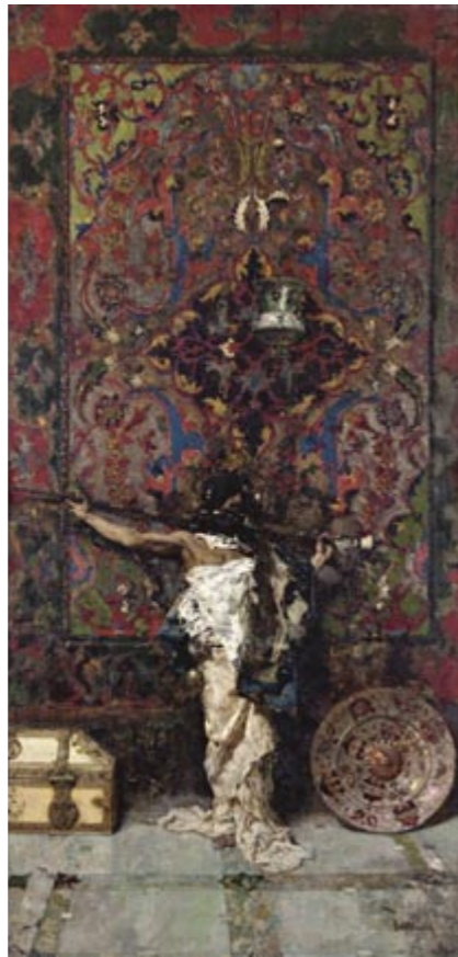
Fig. 5 Mariano Fortuny, Arab Before a Tapestry , c. 1873. Oil on canvas, 150 x 75 cm. Doha, Museum of Islamic Art.

disaffection, a profound unease that prevented him from advancing in the desired direction. From that moment onward, despite the hesitations, renunciations, and doubts, of which there were many, Fortuny began to interpret lived experience in aesthetic terms and did not hesitate to construct, through an appeal to sensibility, a visual universe of his own that came to be governed by autonomous laws, different from natural ones. This conviction was fundamental, for it helped him to see and understand the world in a different way, at times far removed from the logic of rationalist discourse or the principle of universal causality.