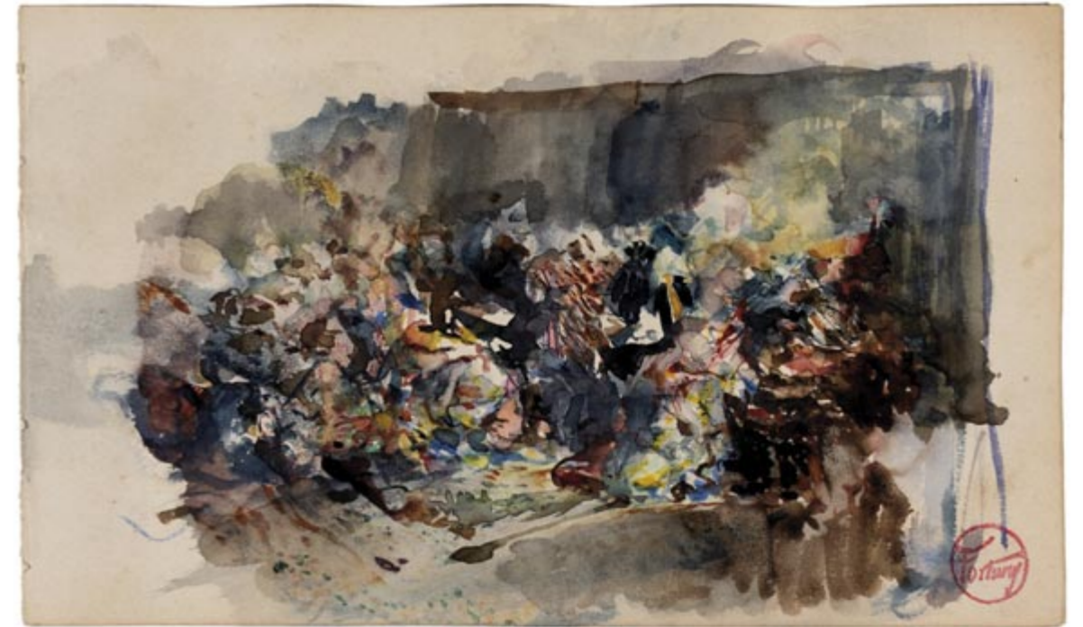
Page 22, recto