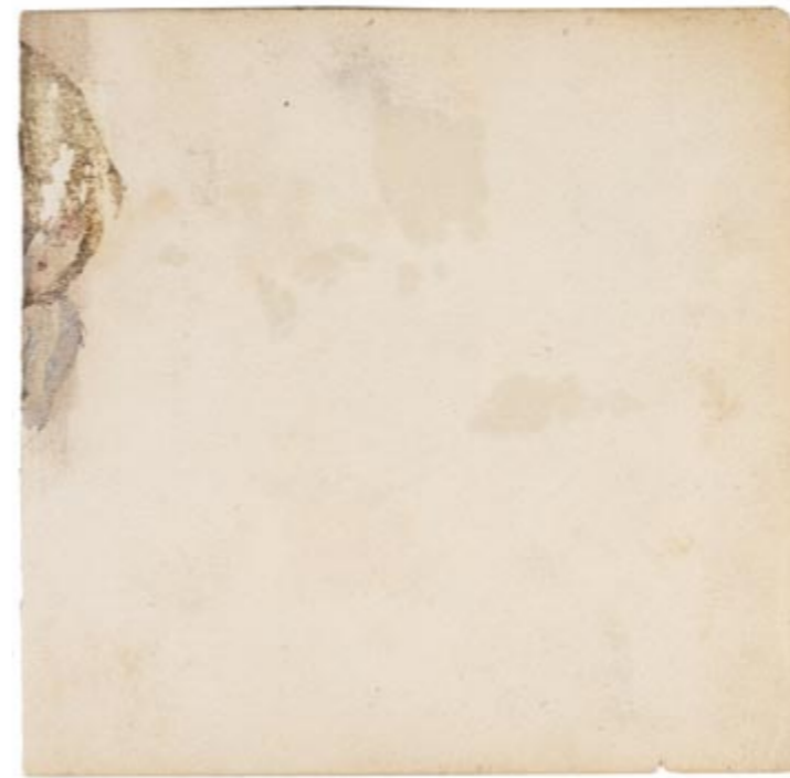
Page 20, recto