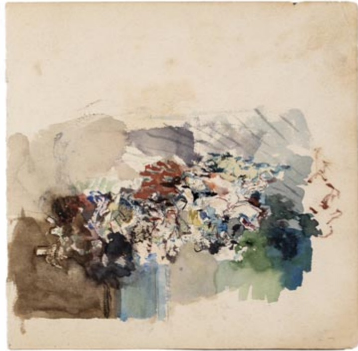
Page 20, verso