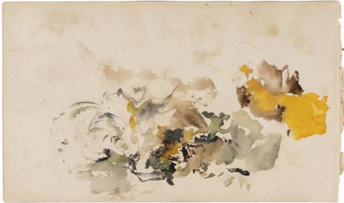
Page 4, verso