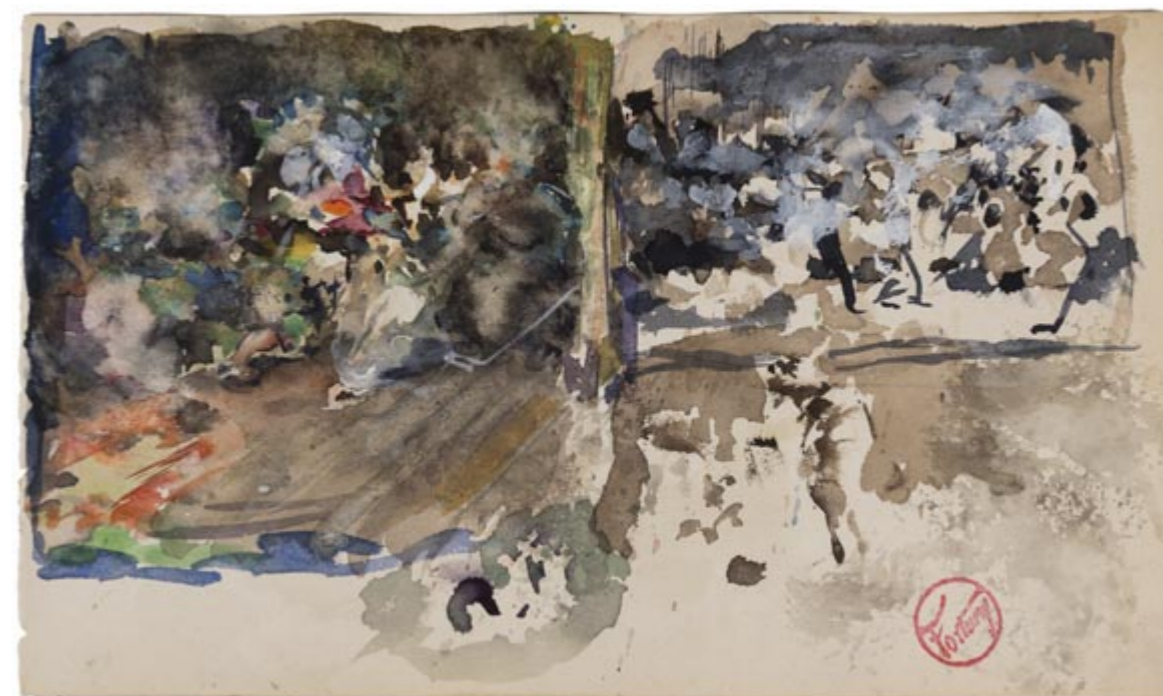
Page 12, recto