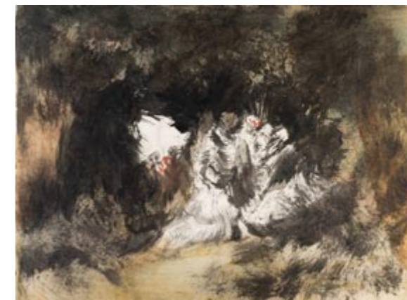
Fig. 3 Eugenio Lucas Velázquez, Scene with Figures , c. 1850. Ink and wash on paper, 250 x 340 mm. Williamstown, The Clark Institute, sold by DELAMANO Old Masters in 2024, inv. 2024.10

Without a doubt, the pages of the sketchbook that we are now bringing to light, and which had remained unpublished until now, form part of the unfolding of a personal intuition and of an innate need to turn the creative process into a continuous act of experimentation; an openness to the possibility of glimpsing a new horizon that places the painter on the threshold of a new era: that of artistic modernity. In this sense, forms and patches of colour parade before our eyes, many of them unrecognizable and implausible, whose content is not easy to decipher because they refer us to the realm of the unconscious and announce themselves as if they were revelations of a dreamlike world, in which imagination and fantasy unfold freely and unconditionally, becoming two of the principal driving forces that activate a creativity removed from the conventions of the visual language of the time. This iconographic repertoire transports us to the very heart of the painter's imagination—one that flows automatically and reveals itself as a highly fertile source for the creation of images, some of which might be described as capricious, recalling a term used by Goya to refer to those