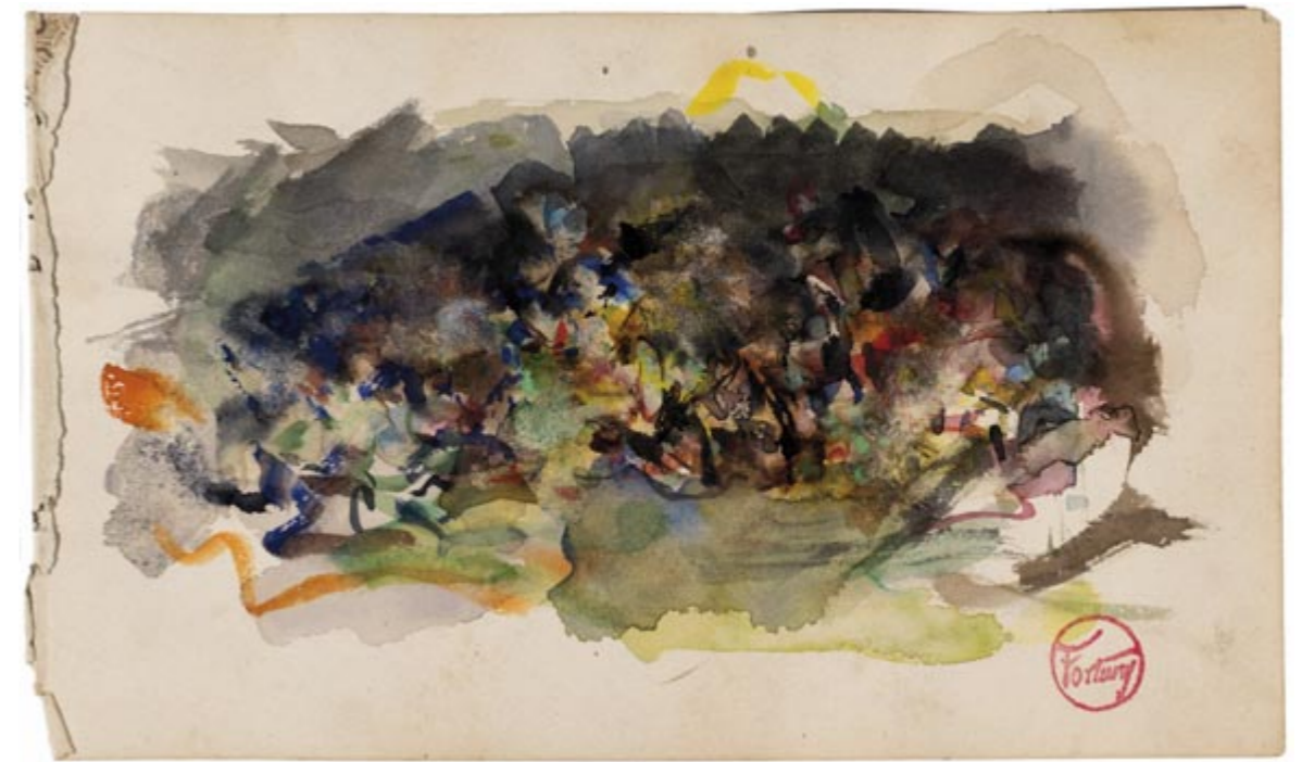
Page 8, recto