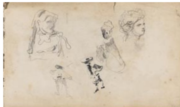
Fig. 12 Mariano Fortuny, Composition , recto of page number 4 of the sketchbook, c. 1870-1874. Watercolour on paper, 123 x 205 mm. Madrid, private collection.

On page 1 we find a phenomenal dispersal of motifs and interests, leading the artist to include a very diverse repertoire. This ranges from the side profile of one of the Granadan models, drawn in ink in the lower right corner, to a pencil depiction of a musical scene in the centre of the sheet, in which some musicians are playing instruments (a violin and a transverse flute). To the right, two figures are depicted with their backs to the viewer; one of them, a man, appears to be dressed in a period jacket. The shading of the model's face is achieved with a network of slightly inclined parallel lines, a stylistic trait characteristic of Fortuny.