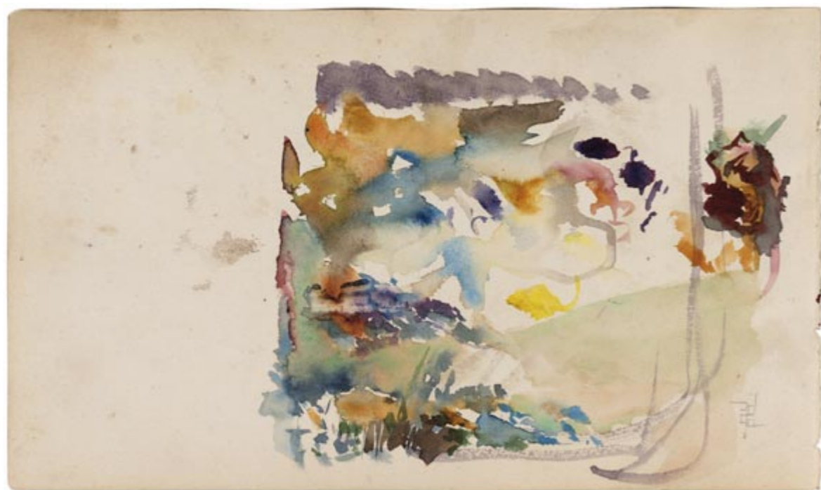
Page 12, verso