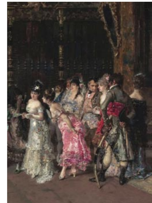
Fig. 7 Mariano Fortuny, The Spanish Wedding , detail, 1870. Oil on panel, 60,5 x 94,5 cm. Barcelona, MNAC, cat. 010698-000

One of the most beautiful, and at the same time most fascinating, examples of the use of this mosaic of colours is found on page no. 10 (verso, fig. 6) of the sketchbook. Here, the artist has deployed a repertoire that produces a magnetic visual effect, as the patches of colour crowd together and take over the entire surface of the paper, generating a phenomenon of horror vacui . Yet in the midst of this intoxication of colour, one can intuit the representation of the profile of a woman wearing a kimono, reminiscent of some of the garments worn by the female figures in The Spanish Wedding (Museu Nacional d'Art de Catalunya, fig. 7). The woman adopts a slightly inclined posture, although it must be said that this perception is more intuited than conveyed by the physical presence of a figure of substantial corporeality. The same