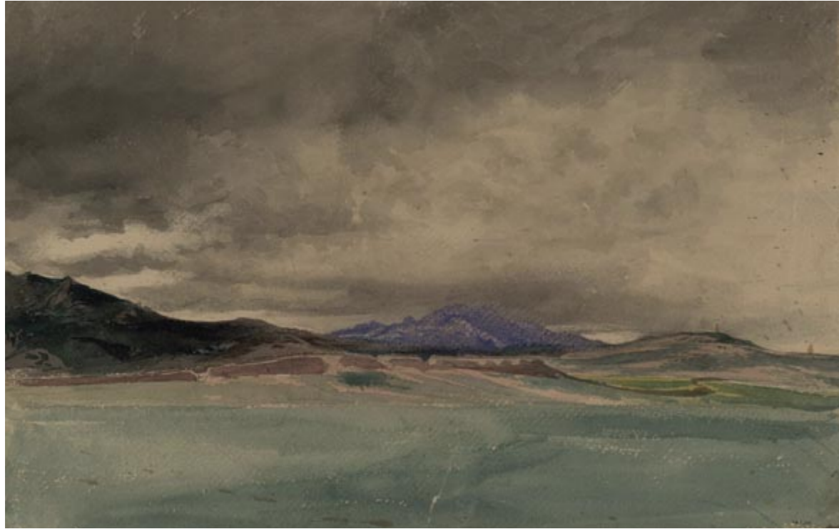
Mariano Fortuny, Moroccan landscape. Study for the Battle of Tétouan , 1860. Watercolour on paper, 287 x 437 mm. Barcelona, MNAC, cat. 046220-D

reflected a sense of frustration when he could not crystallize an artistic idea due to the variable conditions of his environment.