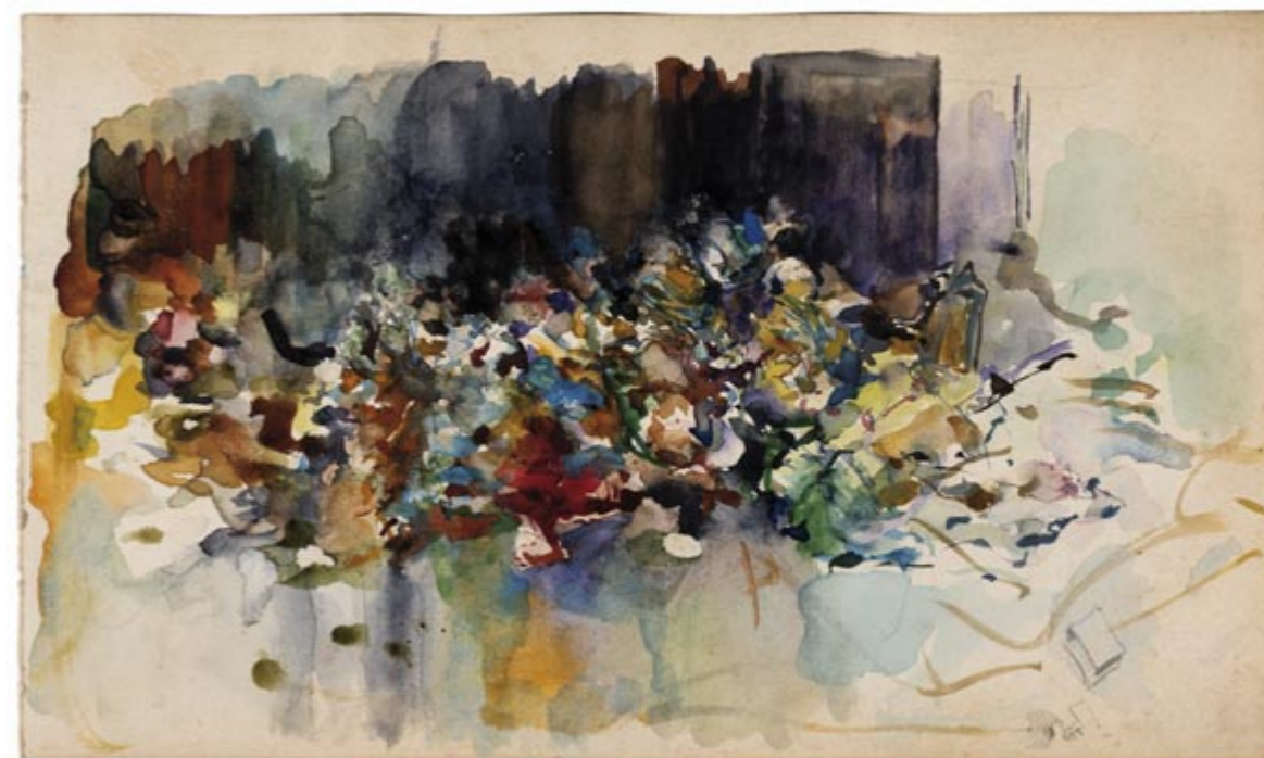
Page 10, recto