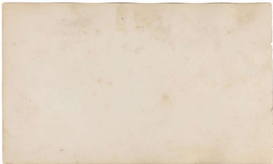
Page 9, verso