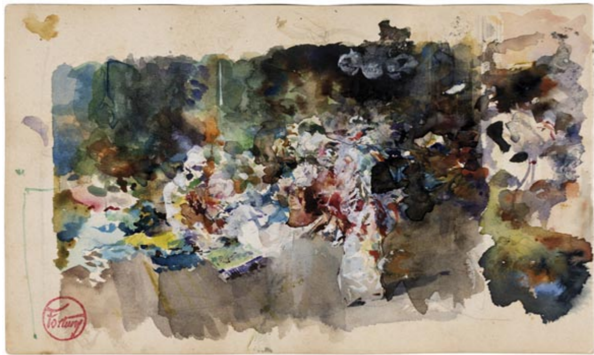
Page 10, verso