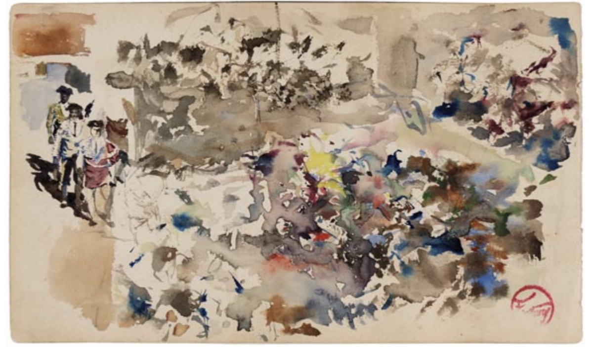
Page 2, recto