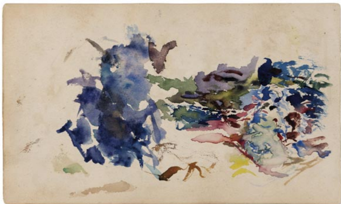
Page 2, verso