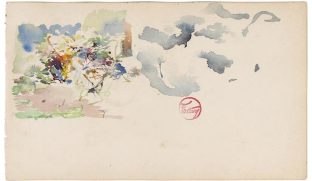
Page 19, recto