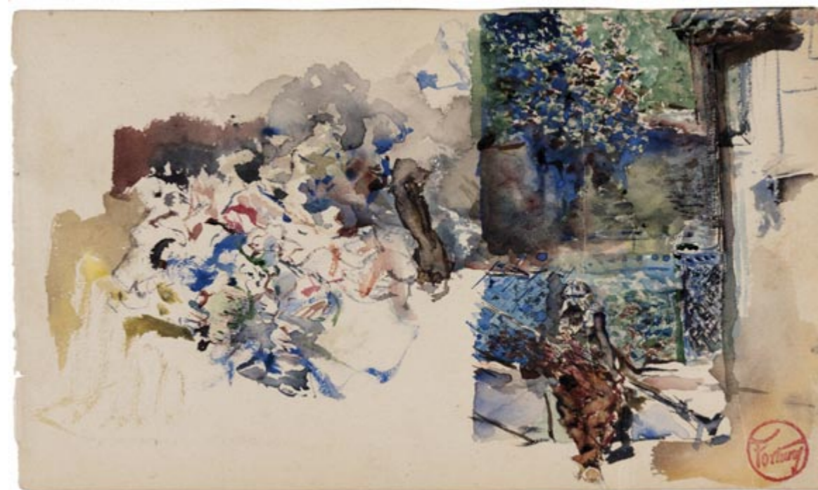
Page 3, recto