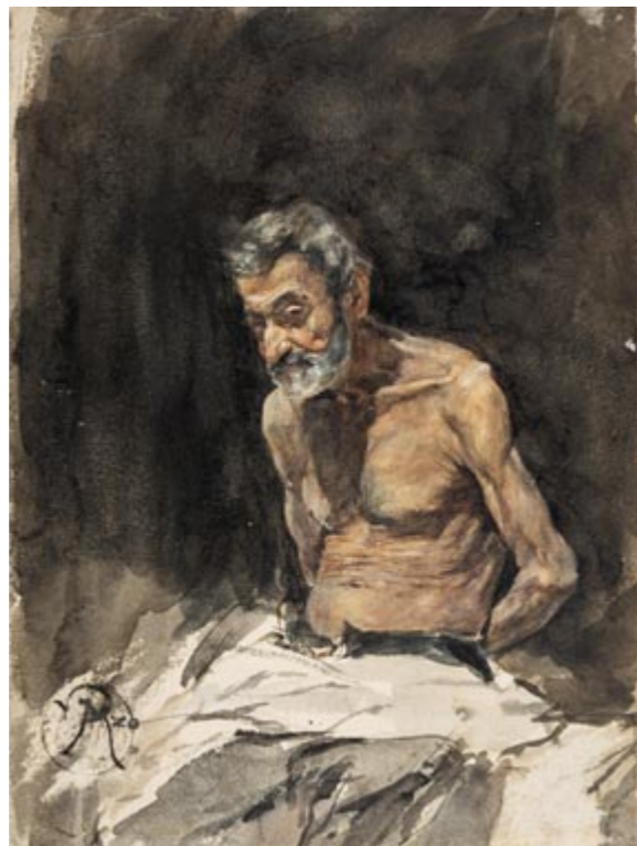
Fig. 10 Ricardo de Madrazo and Mariano Fortuny, Old Man in the Sun , 1870. Watercolour on cardboard, 225 x 165 mm. Dallas, Meadows Museum, sold by DELAMANO Old Masters in 2024

like the sketchbook, belong to the same collection and whose authorship leaves no room for doubt, places us in the most plausible scenario, one that links the entire collection to